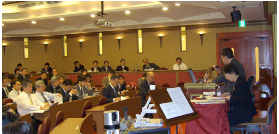
CIWM Präsentation in Tokio vor 100 Bankfachleuten